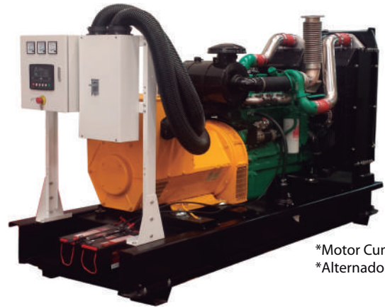
*Motor Cummins *Alternador Stamford

Derateo por altitud : 2% por cada 300m para alturas mayores a 1000 msnm. Para altitudes mayores a 2450 msnm contacte un asesor de Ignacio Gómez IHM SAS. Derateo por Temperatura: 6% por cada 11 grados centígrados para temperaturas superiores a 35%.