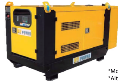
*Motor Lester *Alternador Stamford

Derateo por altitud : 2% por cada 300m para alturas mayores a 1000 msnm. Para altitudes mayores a 2450 msnm contacte un asesor de Ignacio Gómez IHM SAS. Derateo por Temperatura: 6% por cada 11 grados centigrados para temperaturas superiores a 35%.